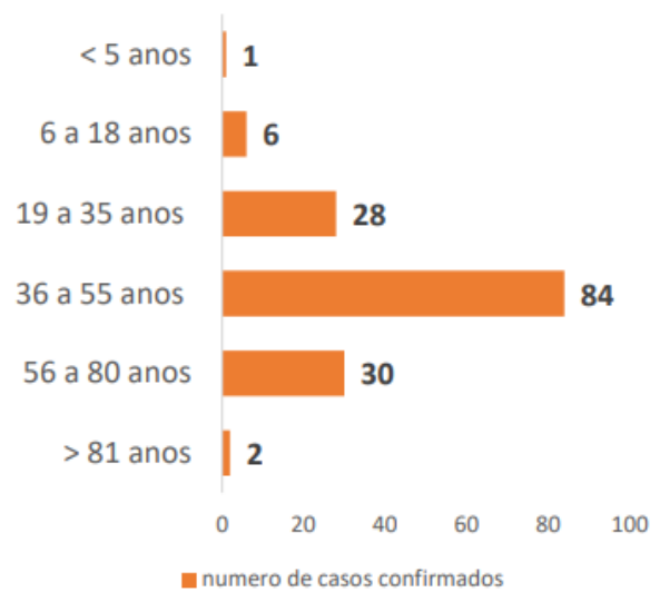
CASOS CONFIRMADOS POR COVID-19 POR FAIXA ETÁRIA EM MATO GROSSO